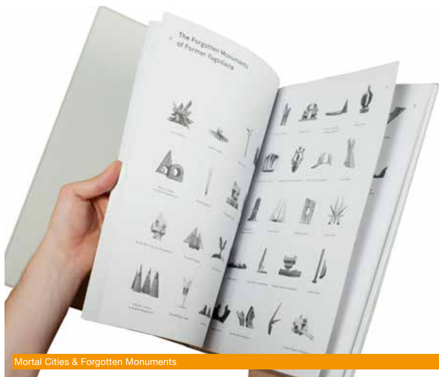
Mortal Cities & Forgotten Monuments