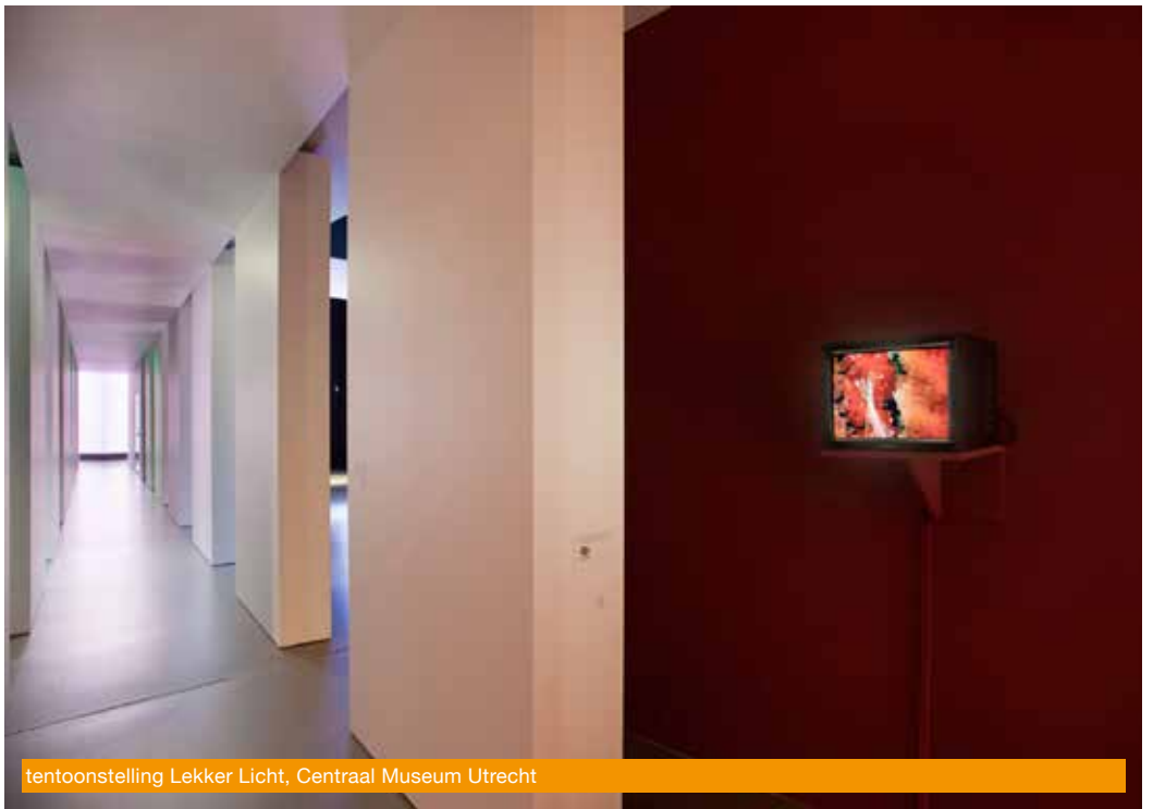
tentoonstelling Lekker Licht, Centraal Museum Utrecht