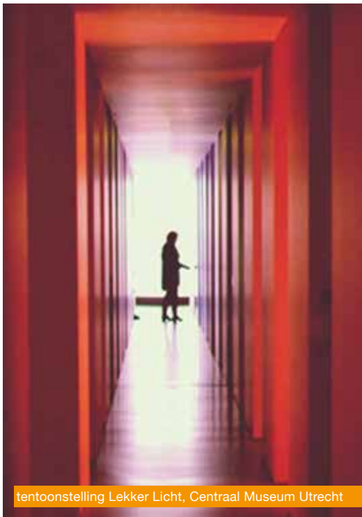
tentoonstelling Lekker Licht, Centraal Museum Utrecht