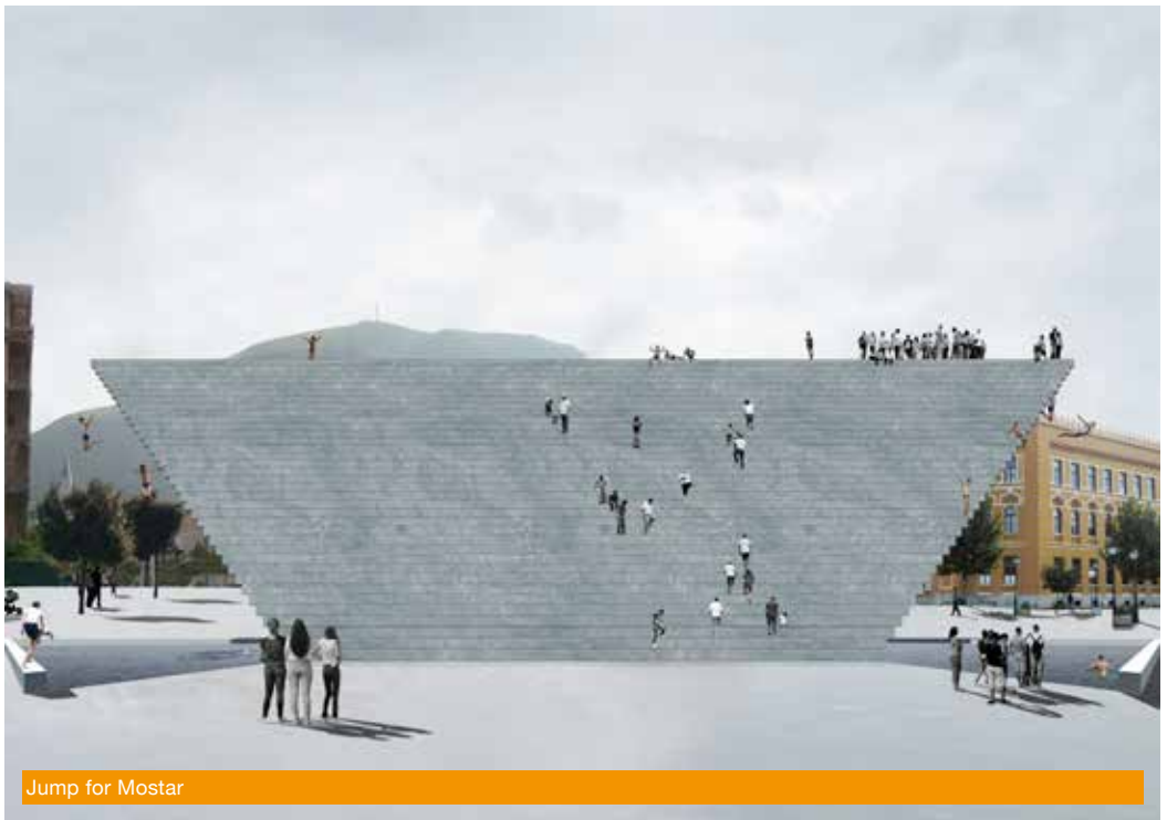
Jump for Mostar