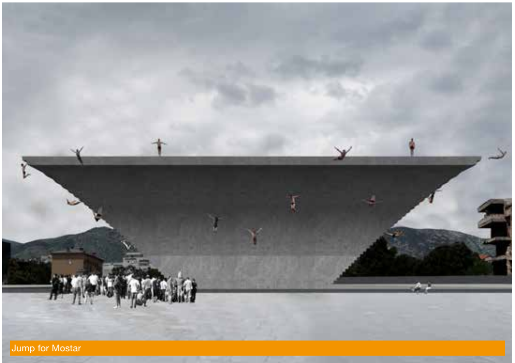
Jump for Mostar